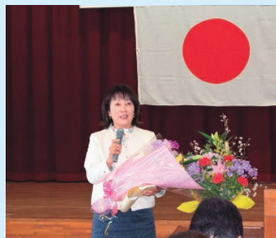
挨拶をする関部長