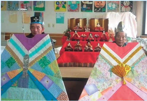
十二単の顔出しパネルで記念撮影

お昼は桃の節句にちなんで「ちらし寿司」と「桜うどん」を堪能し、午後はおやつにヨモギを使った草餅作り、皆さん思い思いの大きさに丸め草餅が完成しました。「手作りはすごくおいしい」「久しぶりに食べた」「みんなと食べるのが何よりおいしい」など、ひなあられをつまみ、甘酒や梅昆布茶を飲みながらおしゃべりを楽しみました。まだまだマスクが外せない毎日ですが、今日は終始笑顔が絶えない日となりました。ひたむきに頑張っている利用者さん、これからの健康を願います。