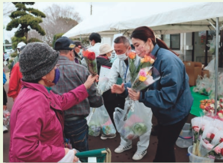
▲参加者全員にバラやレタスをプレゼント