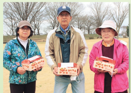
▲商品が全員に手渡されました!!