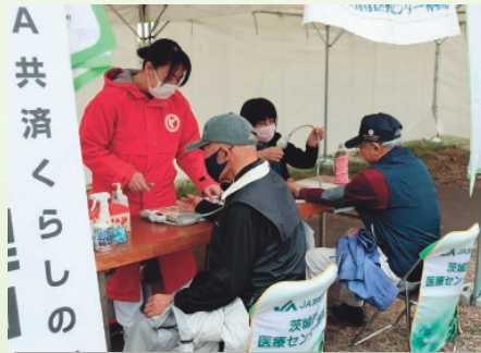
▲健康相談コーナー