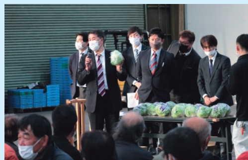
出荷規格統一へ向け意見交流を行った

同地区の春野菜の出荷は3月上旬から5月下旬。レタスは4月上旬、サニー、カールは3月下旬に出荷のピークを迎えています。