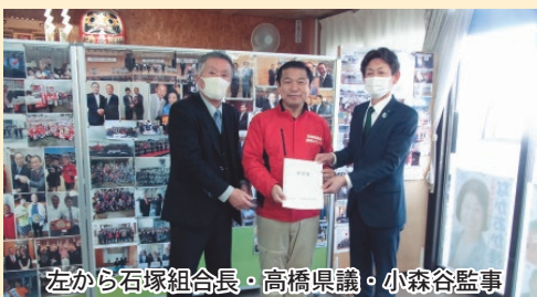
左から石塚組会長・高橋県議・小森谷監事