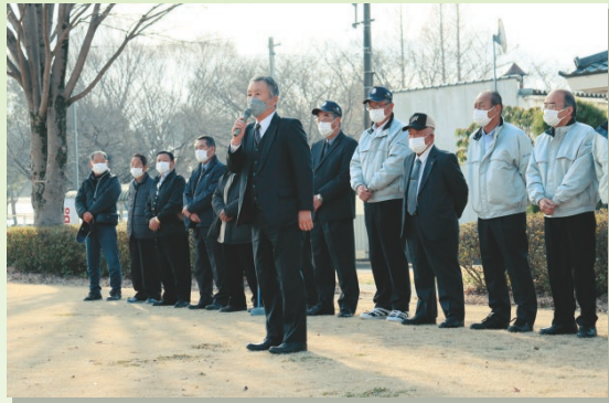
挨拶をする石塚組会長

茨城むつみは3月2日、境町ふれあいの里公園で第1回年金友の会グラウンドゴルフ大会を開催しました。大会当日は天候にも恵まれ当会員173名が参加し、32グループに分かれ8ホール×4コースの計32ホールをプレーし、熱戦を繰り広げました。当会場では、地域貢献活動の一環として茨城西南医療センター病院の看護師による健康相談コーナーを設け、参加者の血圧の測定や健康相談に応じました。また、当JA管内のレタスやバラが配られた地元農産物のPR活動も行いました。参加者は「記念すべき初めての大会に出場できて嬉しい、とても盛り上がったので来年はもっと年金友の会の仲間を増やして参加したい」と嬉しそうに話しました。