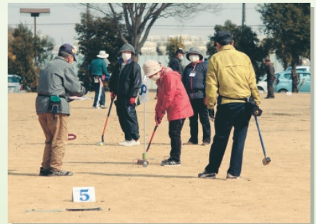
▲プレーを楽しむ参加者