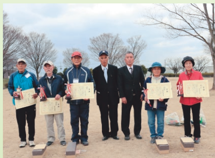
▲入賞者のみなさん