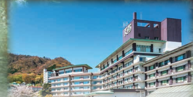
写真はすべてイメージです。