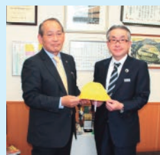
境町へ交通安全帽子寄贈

関稔常任理事は「今後も地域の皆様の安全・安心のため、地域貢献活動に取り組んでいきたい」と話しました。