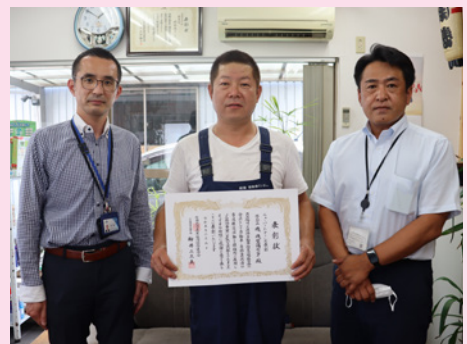
(株)磯 磯整備センター様

J A共済連茨城県本部主催による、令和4年度全国協力会表彰 自動車・自賠責共済新契約実績及びレックカー・ロードサービスに関する指定工場表彰のニューパートナーズ表彰で、J A茨城むつみ管内の代理店「(株)磯 磯整備センター」が表彰されました。 ニューパートナーズ表彰（獲得増加件数にかかる表彰の部）とは新契約の自動車共済・自賠責共済の契約件数が対前年度に比して増加した件数が30件以上であり、県本部協力会において最上位の1指定工場が推薦されるもので、今回は前年度より50件増加で表彰となりました。