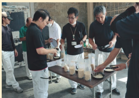
初頭検査を行う職員

検査では、粒ぞろいや水分、色沢、乳白について確認し、統一した目合わせを実施しました。当JAでは農産物検査員14名が、10月下旬まで各地区で検査を行います。