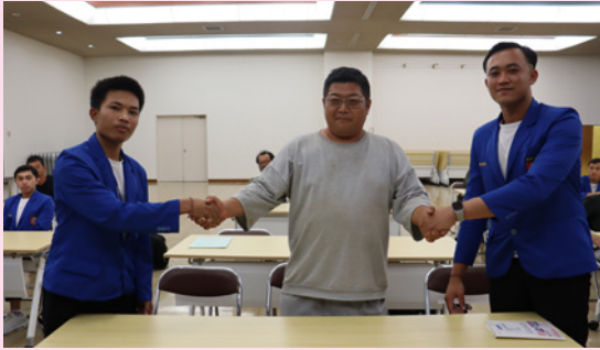
握手を交わす受入農家と実習生

J A茨城むつみは8月末日、第43期外国人農業実習生対面式を本店にて開き、インドネシア人実習生16人が13件の受入農家と対面しました。実習生は9月1日から受入農家のもとで、3～5年間の実習生活をスタートしています。 第43期生は来日してから1ヶ月間、日本語をはじめ日本の法律、文化を学ぶ研修生活を終了し、受入農家と対面しました。実習生は一人ひとり、それぞれの受入農家に自己紹介をし、握手を交わしました。