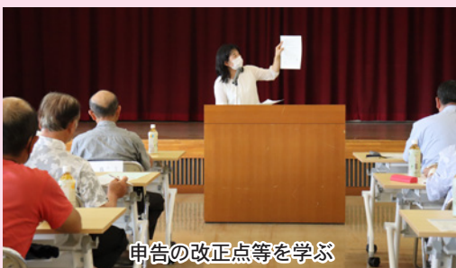
申告の改正点等を学ぶ

J Aでは、会員の申告補助を行うことで、会員の申告や経理事務の負担を減らし、農家が農業に専念できる環境づくりと適正な納税を実現することを目的として、年間で3回ほどJ A専任担当者らが記帳代行面談、11月頃に仮決算説明会を行っています。