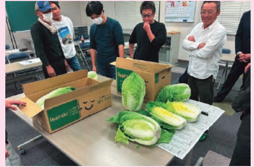
規格を確認する生産者

同地区の秋冬はくさいの出荷は12月中旬に出荷のピークを迎え、2月下旬まで出荷が続き、今年度は出荷量8万ケース（1ケース15 キ 、13 キ ）を見込みます。