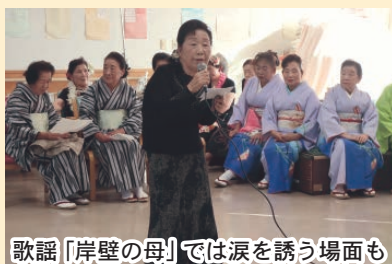
歌謡「岸壁の母」では涙を誘う場面も

をとお招きし日本舞踊やフラダンス、歌謡を披露していただきました。最後は「猿島豊年音頭」をスタッフも交じりみんなで輪になって踊り今年も憂いも忘れ、楽しい一日を過ごしました。