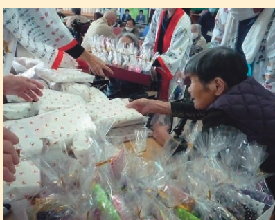
ビンゴ大会でお土産ゲット

をとお招きし日本舞踊やフラダンス、歌謡を披露していただきました。最後は「猿島豊年音頭」をスタッフも交じりみんなで輪になって踊り今年も憂いも忘れ、楽しい一日を過ごしました。