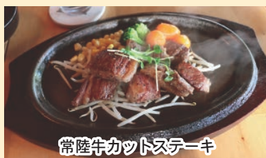
常陸牛カツステーキ