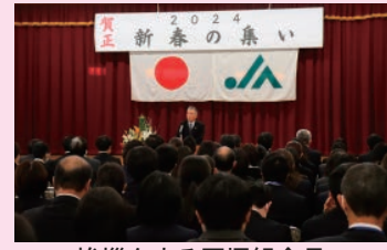
挨拶をする石塚組合長

地域のみなさまに喜ばれるJAをモットーに役員一丸となって業務に励んでいただきたい」と挨拶しました。 また、永年勤続者の表彰を行い、勤続年数25年以上の職員2名に感謝状と記念品を贈り、優秀職員として、金融渉外1名、共済渉外2名、経済渉外2名の方が表彰されました。