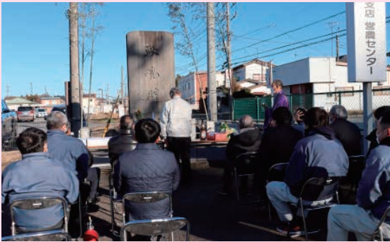
獣魂碑を前に祈りを捧げる参加者

同部会は、安心・安全をモットーに県の銘柄豚である「ローズポーク」などを年間約2,500頭出荷しています。同日の獣魂祭に参加し、手を合わせた関係者は「今後も命の恵みに感謝することを忘れずに、良品出荷に努めたい」と話しました。