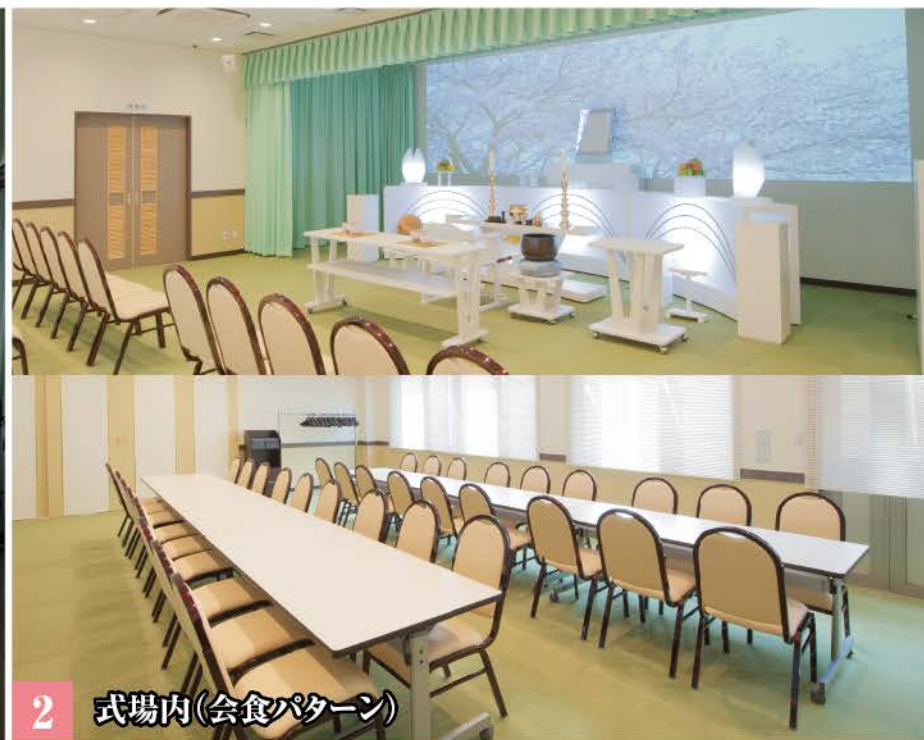
2 式場内(会食パターン)