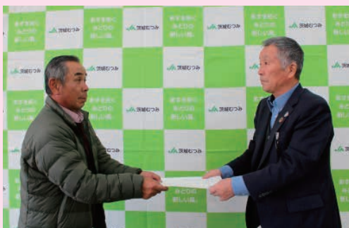
契約書を取り交わす石塚組合長と実習生受入農家

J Aからは実習生の新たな受入、または契約更新の際の注意点について説明があり、その後受入農家とJ Aが調印し、契約書を取り交わしました。