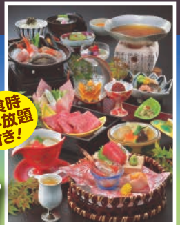
写真はすべてイメージです。